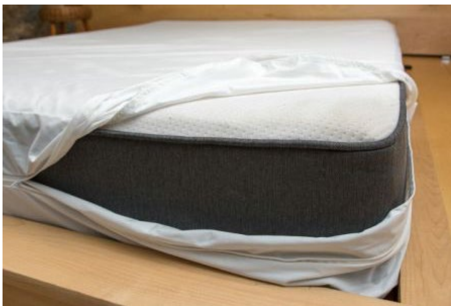
Figura 1 – Capa para colchão com zíper

Combater o ácaro da poeira doméstica não é tarefa fácil, principalmente em ambientes úmidos cuja concentração alcança 1.000 ácaros por grama de poeira. Um colchão pode apresentar de 10.000 a 10 milhões de ácaros e aproximadamente 10% do peso de um travesseiro com dois anos de uso pode ser devido à presença de ácaros mortos. 1 O colchão deve estar envolvido em tecido impermeável ou plástico e ser lavado semanalmente com água quente para remoção do ácaro e alérgenos. Atualmente, são comercializadas capas ( Figura 1 ) confeccionadas com tecido sintético de microfibra, constituído por 25% de algodão e 75% de poliéster. Este tecido apresenta poros de 5 microns, permitindo a passagem do ar, mantendo o colchão e travesseiro ventilados, porém, impede a passagem da poeira doméstica com os alérgenos dos ácaros (10-30 microns) e/ou os alérgenos do gato (5-6 microns).